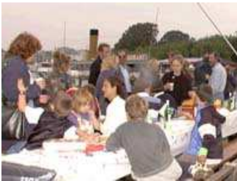
Photo du bas : table de 1,4 km à Genève en 1999